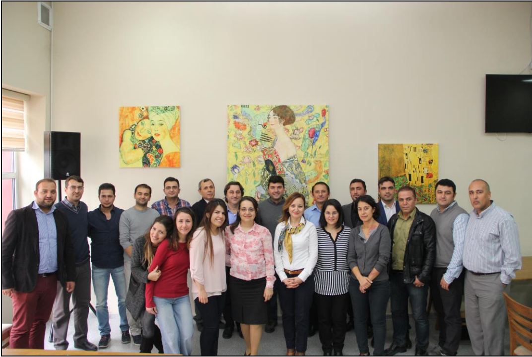
ğretmenler Gn Sylei