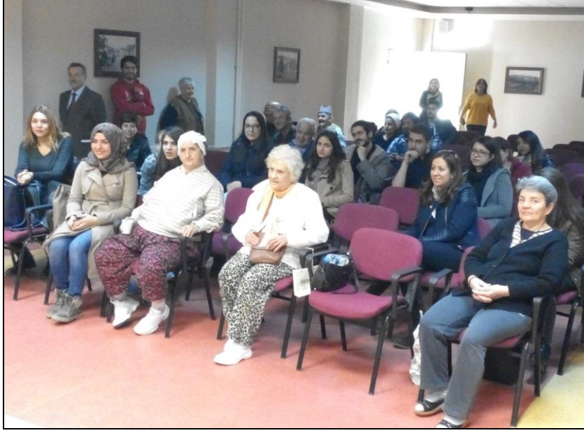
Gençler yaşlılar Elele