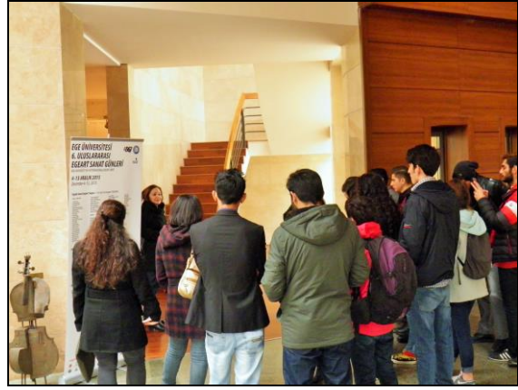
Ahmet Adnan Saygun Sanat Merkezi